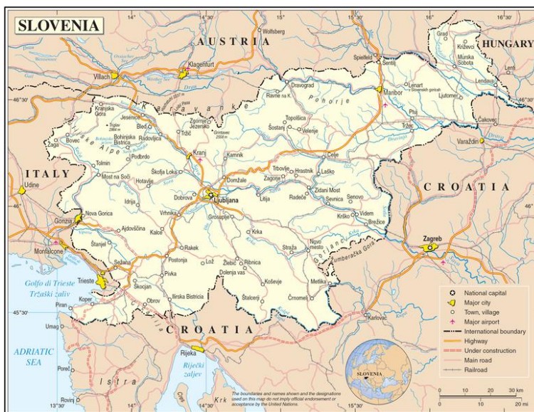
Cartographer of the United Nations

und Dolmetscher der Universität Ljubljana. Sie übersetzt Literatur (u.a. Ingeborg Bachmann und Daniel Kehlmann) sowie wissenschaftliche Bücher (u.a. Wittgenstein) und dolmetscht für unterschiedliche Institutionen der EU.